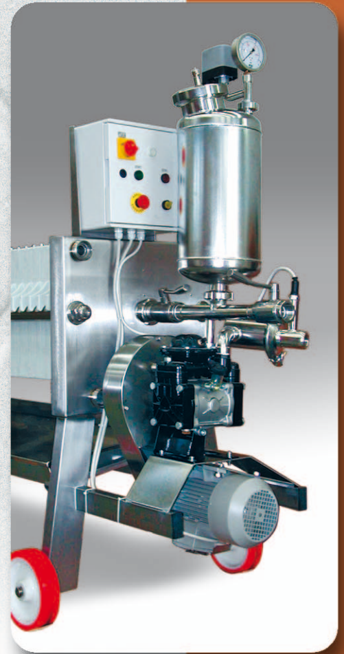
POMPA ALIMENTAZIONE PRODOTTO VOLUMETRICA A MEMBRANA VOLUMETRIC PRODUCT FEEDING PUMP DIAPHRAGM TYPE