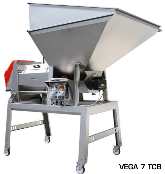
VEGA 7 TCB