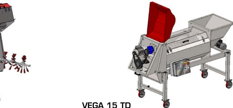
VEGA 15 TD

Cilindro forato in polietilene. Polyethylene holed cage.