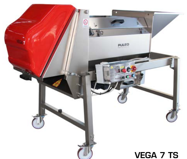
VEGA 7 TS