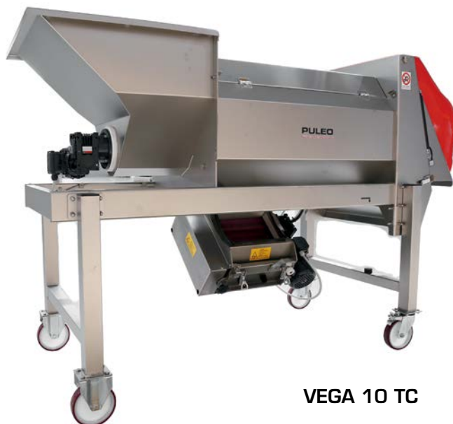
VEGA 10 TC

Available with plain hopper (TS) or hopper with screw (TC), as standard version.