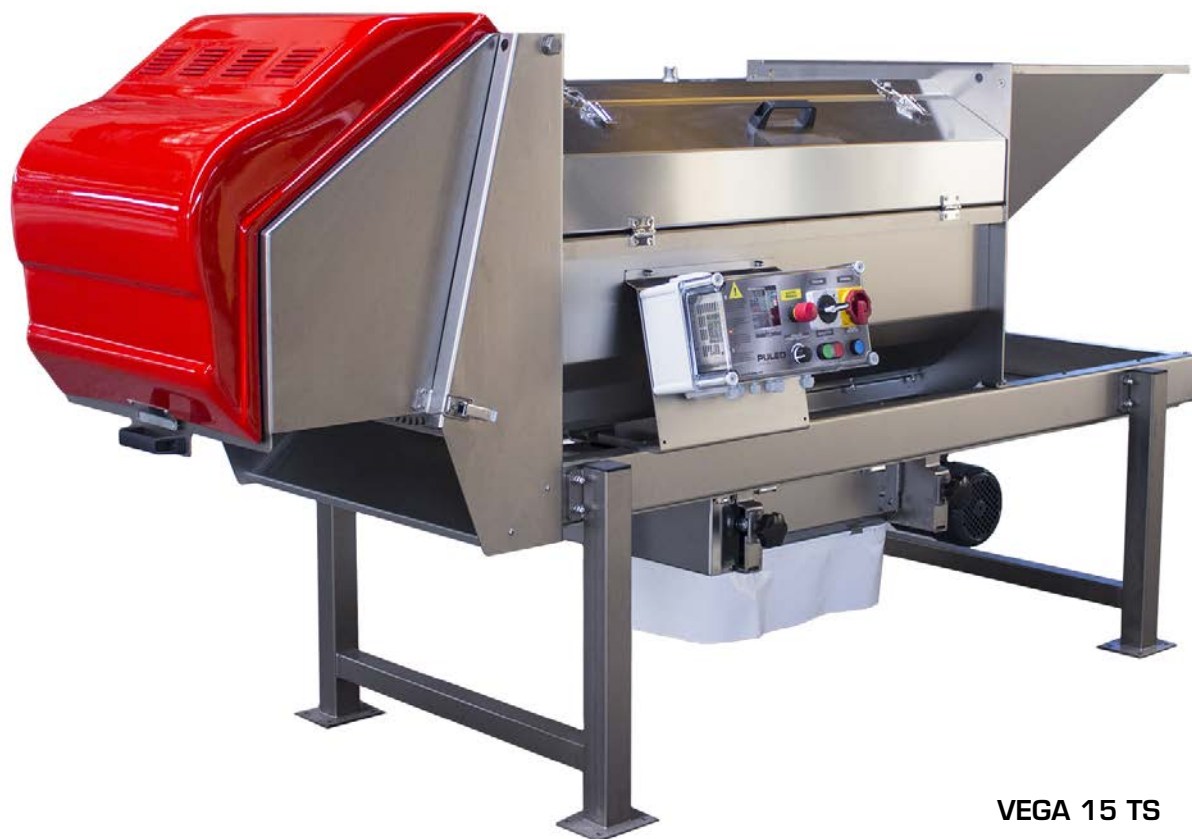
VEGA 15 TS

The Vega 15 crusher has a different sliding system as it takes places on two rails to allow horizontal relocation and to performs crushing/non-crushing processes.