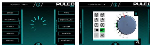
Schermo PLC: selezione tipo di pressatura e pagina pressatura in corso con grafico online di pressatura.